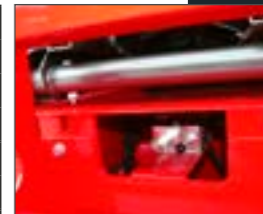
VALVOLA RILASCIO FRENO