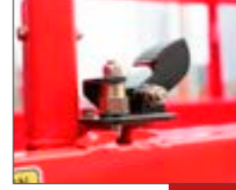
APERTURA A PIEDE PER ESTENSIONE PIATTAFORMA